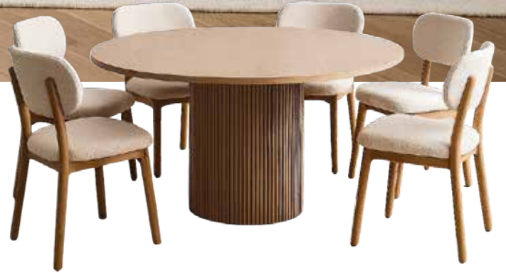
BAHAMA YEMEK MASASI