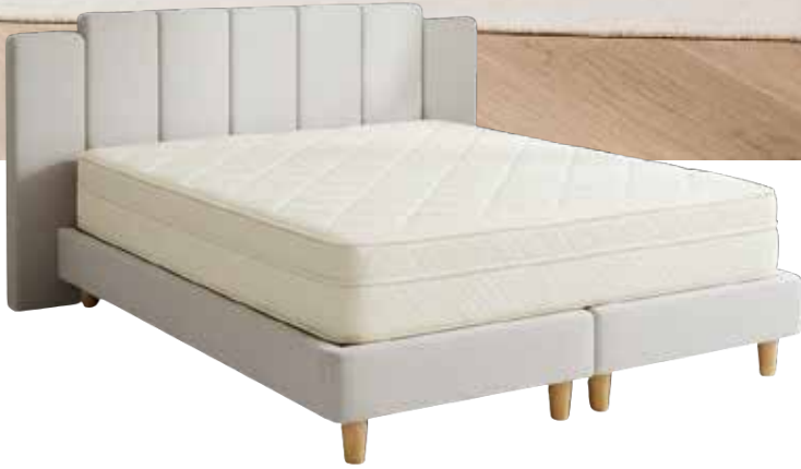
FİNGER BAZA & BAŞLIK