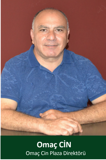
Omaç CİN Omaç Cin Plaza Direktörü

"Mobilya, beyaz eşya, ev tekstili, yaylı yatak üretimi gibi faaliyetlerimizi var"